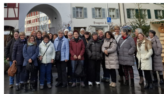
FG Buechen-Staad geniesst einen stimmungsvollen Rundgang auf dem Weihnachtsmarkt in Willisau.