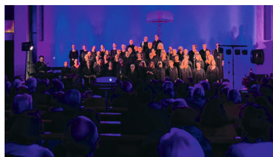
Weihnachtliche Klänge: Der Gospelchor life mit „It's Christmas Time“ in der Kirche Buechen-Staad.

Gemeinsam in der Bibel lesen, Fragen stellen, Gedanken teilen und den Glauben mit dem eigenen Leben verbinden – danach ein einfacher gemeinsamer Znacht. Herzliche Einladung zum Bibelabend am Donnerstag, 29. Januar im Pfarrsaal Buechen-Staad mit Seelsorger Klaus Heither. Willkommen sind alle, die kommen wollen. Weitere Informationen in der nächsten Spalte.