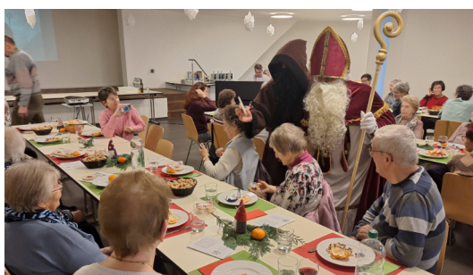
Hoher Besuch: Samichlaus und Schmutzli beim Begegnungsnachmittag im Pfarrsaal Buechen-Staad.

Am Donnerstag, 29. Januar laden wir herzlich zu einem Bibelabend im Pfarrsaal Buechen-Staad ein. Von 17:00 bis 19:30 Uhr nehmen wir uns Zeit, gemeinsam auf ein biblisches Wort zu hören und darüber ins Gespräch zu kommen. Nach einem kurzen Gebet lesen wir einen ausgewählten Bibeltext, tauschen Gedanken, Fragen und persönliche Erfahrungen aus und suchen gemeinsam nach Bezügen zu unserem eigenen Leben und Alltag. Offenheit, Zuhören und gegenseitiger Respekt stehen dabei im Mittelpunkt. Zum Abschluss lassen wir den Abend bei einem einfachen gemeinsamen Znacht ausklingen. Alle Interessierten aus unserer Seelsorgeeinheit