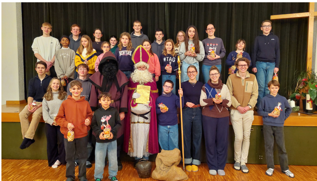
Ministrant*innen aus Altenrhein, Buechen, Rheineck und Thal halfen dem Schmutzli, der leider ein Loch in seinem Sack hatte und deshalb alles auf dem Weg verloren hat. Der Samichlaus war stolz auf unsere Minis.