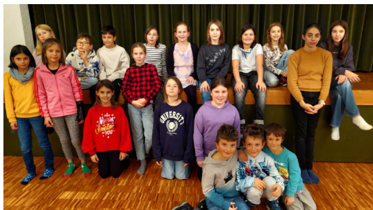
Kinder ab der dritten Klasse gestalten Weihnachtsge-schenke und geniessen den Nachmittag.

Kinder sind mit ihren Familien herzlich zur Kirche Kunterbunt am 18. Januar von 10:00 bis 13:00 Uhr ins Vikariat St. Margrethen eingeladen.