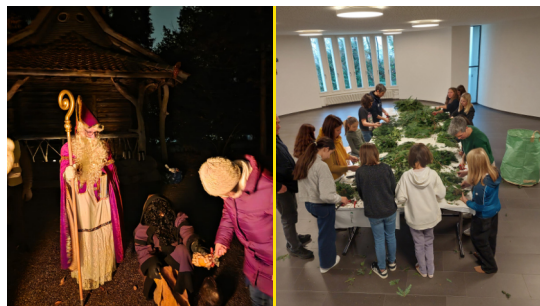
Samichlaus und Schmutzli besuchen die Kinder im Se-farpark; eifrig wurden Adventskränze hergestellt.

Die Anlässe finden Sie auch auf jukiprogramm.ch