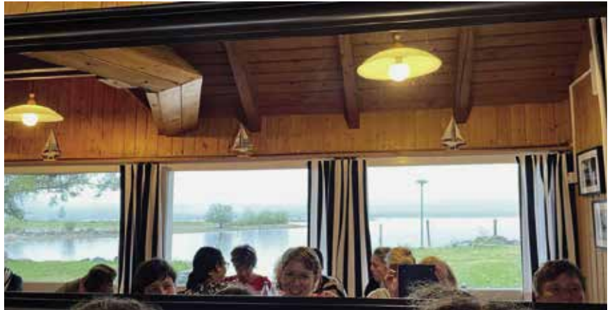
Gemütliches Beisammensein (Marina Altenrhein, 2022)

Neu im Angebot der Frauengemeinschaft Altenrhein ist der «De-Sache-wiiter-fertig-mache-Abig». Dieser Abend findet einmal monatlich am 1. Montag des Monats im Pfarreiheim Altenrhein ab 19 Uhr statt. Die Idee dieses Abends ist es, begonnene Arbeiten, die schon lange zuhause herum liegen, zusammen mit anderen anzugehen. Dazu gehören z.B. digitale Aufräumarbeiten, Briefe schreiben, Rechnungen sortieren, Näharbeiten beenden, Geschenke basteln, Werkzeug flicken, Menueplan für die Woche aufstellen. Es wird erwartet, dass es mit der Zeit auch möglich ist, Ressourcen an diesem Abend auszutauschen. So könnte es z.B. vorkommen, dass eine Frau