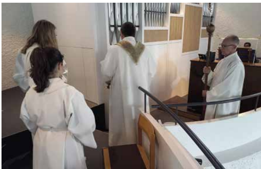
Weihe der Pfeifenorgel in Buechen-Staad