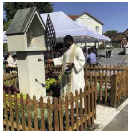
Segnung des Bildstöcklis «Stella maris» in Altenrhein

Mit 14 Paaren aus unseren beiden Pfarreien begingen wir am 15. Mai ihr Ehejubiläum. Am 12. Juni feierten wir in Altenrhein den letzten ökum. Gottesdienst zusammen mit Pfr. Klaus Steinmetz. 20 Jahre schätzten wir seine guten Predigten und Impulse an gemeinsamen Gottesdiensten und Anlässen der Senioren. Die meditativen Gottesdienste, die mehrmals im Winter angeboten wurden, boten den Teilnehmern mit Liedern aus Taizé Ruhe und Besinnung. Während der Adventszeit stand in beiden Kirchen ein kunstvollgestalteter Wegweiser. In den erfreulich gutbesuchten Rorate-Feiern begaben wir uns symbolisch auf Wegen nach innen, zum anderen und zur Krippe.