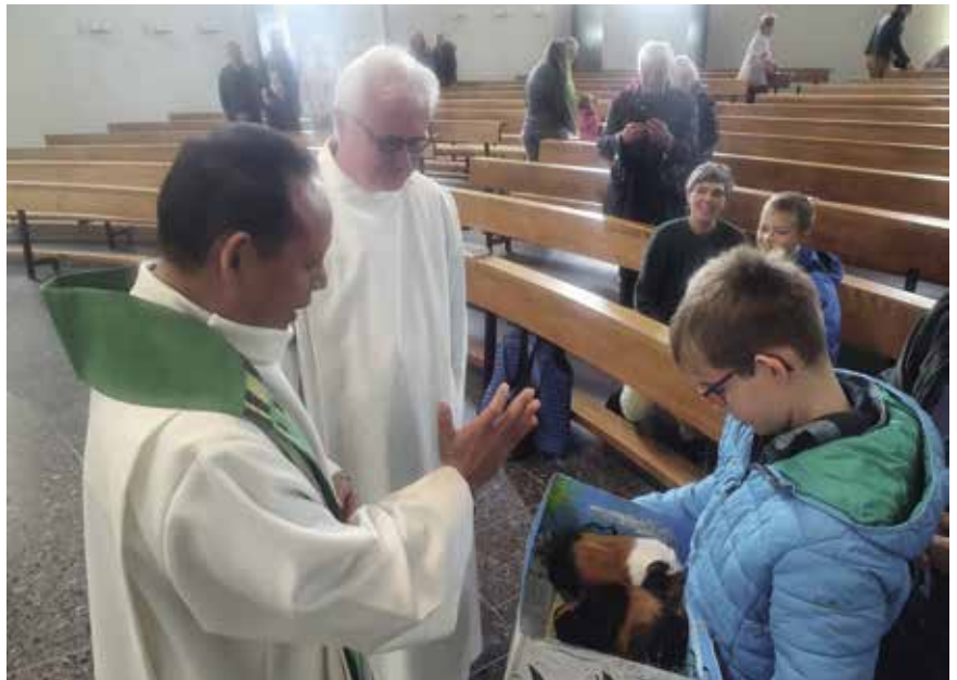
Gottesdienst für Zwei- und Vierbeiner.

alle Besucher im Festzelt eine gute Verpflegung. Die Pfarreien Altenrhein, Buechen-Staad und Thal feierten am 25. September 2022 zum ersten Mal gemeinsam einen Open-Air-Gottesdienst am Ausflugsziel Steiniger Tisch. Die Atmosphäre in der schönen Natur wurde von Vielen sehr geschätzt. Zum Gedenktag des heiligen Franziskus, dem Schutzpatron der Tiere, luden wir erstmalig in Buechen-Staad zu einem Gottesdienst mit Tiersegnung, den einige Zwei- sowie Vierbeiner freudig besuchten.