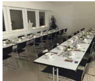
Rorate- Frühstück (2022)

Organisation), ein Spieleabend, eine Atempause (gemeinsames Singen mit ausgesuchten Texten), das Adventskranzen mit Kranzverkauf im Dorf (Erlös zugunsten einer gemeinnützigen Organisation, Spende 2022: CHF 1200.- Flutopfer Pakistan) sowie abschliessend dreimal ein gemeinsames Frühstück im Anschluss an das Rorate: